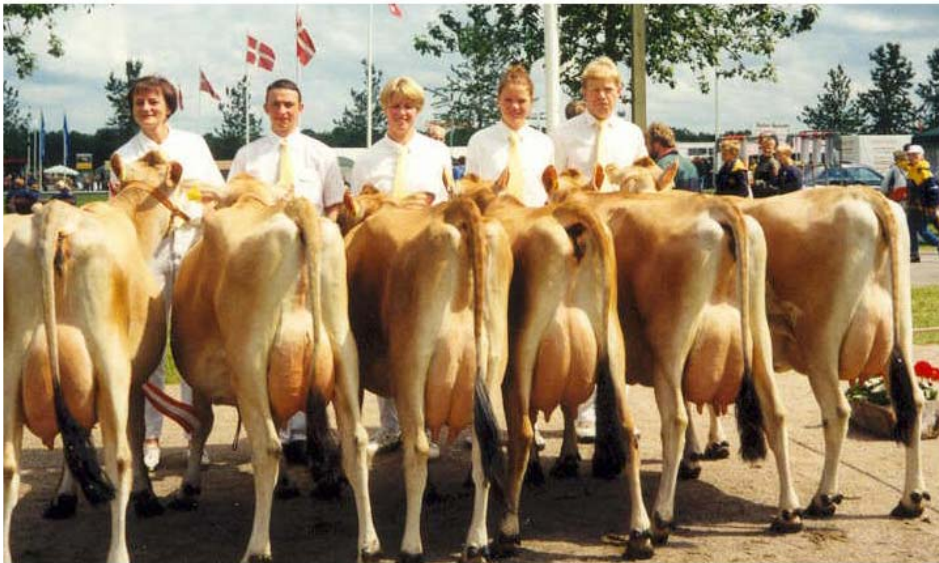
besætningsgruppe fra landsskuet i Herning