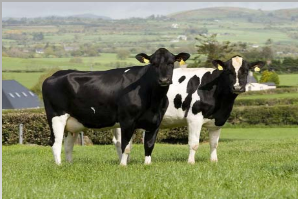
NRF-kryssninger på beite i Irland